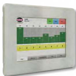
Panel dotykowy RHINO